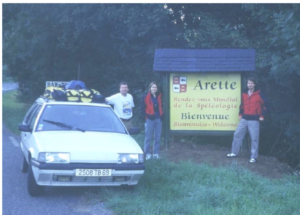
Arette, capitale mondiale de la spéléologie ?

médecin lui diagnostiquera une rupture du pot d'échappement.