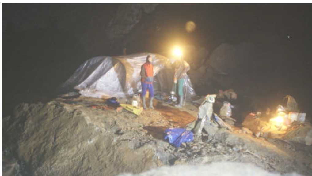
Le bivouac dans la Salle de l'Eclipse Songe d'une nuit d'été