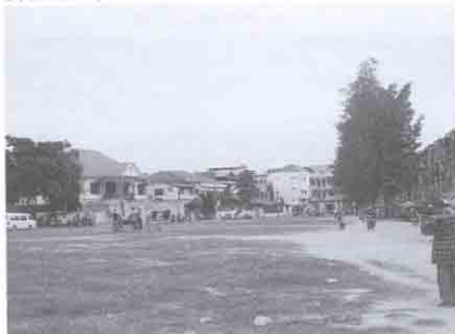
L'esplanade le long du boulevard Samdech-Sothearos, à l'ouest du bâtiment.

Construit à l'origine sur pilotis, le rez-de-chaussée devait servir de parking pour les voitures et présen-